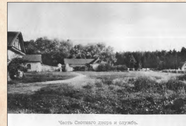
Часть Скотного двора и службы.

Школа — кирпичное здание общей площадью 502,3 кв.м, в настоящее время облицовано досками и окрашено. Здание вытянуто по продольной оси «север-юг», прямоугольное в плане, асимметричное, было усложнено ризалитами на северном и южном фасадах (утрачены) и раскреповками на торцевых фасадах. К торцам здания пристроены деревянные закрытые веранды.