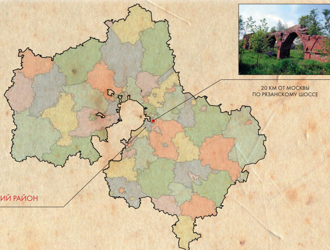
20 км от Москвы по Рязанскому шоссе

Ориентировочные (предварительные) затраты на восстановление объекта: 500 млн. руб. Ориентировочная стоимость объекта с учетом земельного участка: 200 млн. руб.